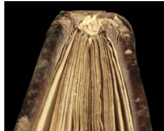
Milano, Archivio Storico Civico e Biblioteca Trivulziana, Cod. Triv. 777 (capitello superiore)